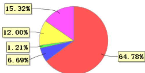
投资组合资产配置图表(2021年6月30日)

● 固定收益投资 ● 买入返售金融资产 ● 其他各项资产 ● 权益投资 ● 银行存款和结算备付金合计